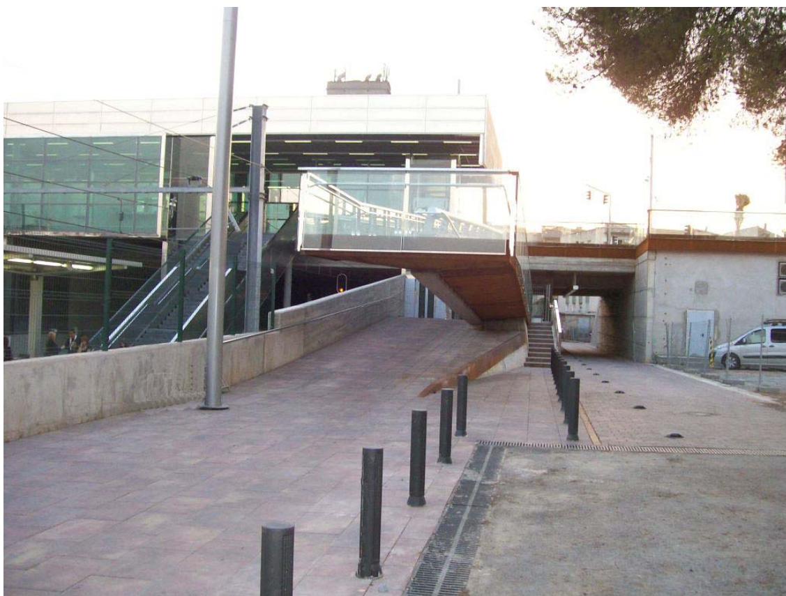
Pas inferior a l'antic carrer de Montserrat

A més, es van urbanitzar i enjardinar els carrers contigus, es van condicionar les façanes dels edificis del carrer de Montserrat, i es va construir una nova rotonda amb l'objectiu de facilitar la connexió entre el carrer Nou de Montserrat i l'avinguda de Joaquim de Barniola.